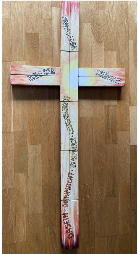
Ostern—Weg der Erlösung