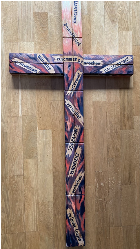
Kartage—Weg des Leidens