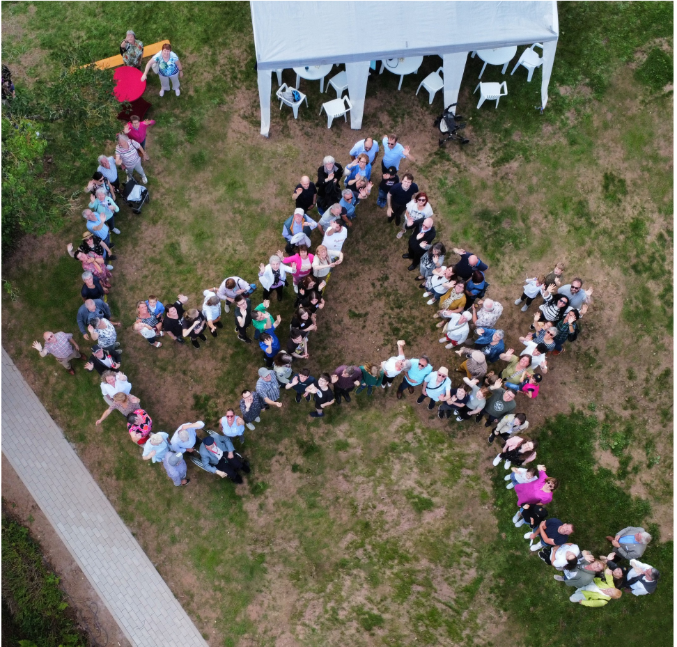
St. Anna-Fest 2024