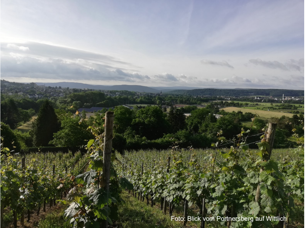
Blick vom Portnersberg auf Wittlich

Das Jahr steht auf der Höhe, die große Waage ruht. Nun schenk uns deine Nähe und mach die Mitte gut. Herr, zwischen Blühn und Reifen und Ende und Beginn. Lass uns dein Wort ergreifen und wachsen auf dich hin.