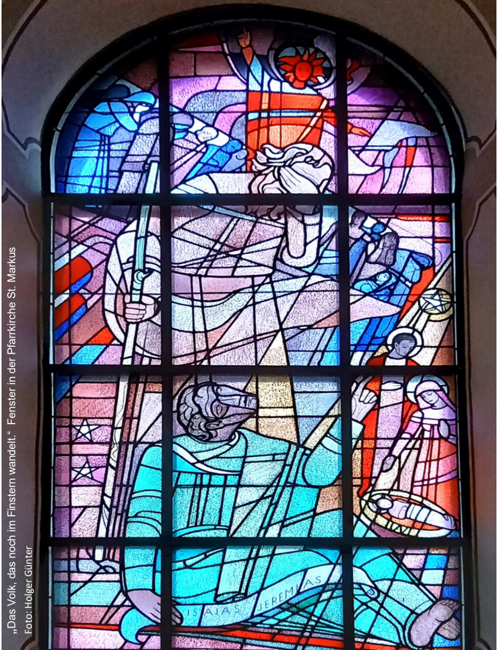
„Das Volk, das noch im Finstern wandelt.“ Fenster in der Pfarrkirche St. Markus