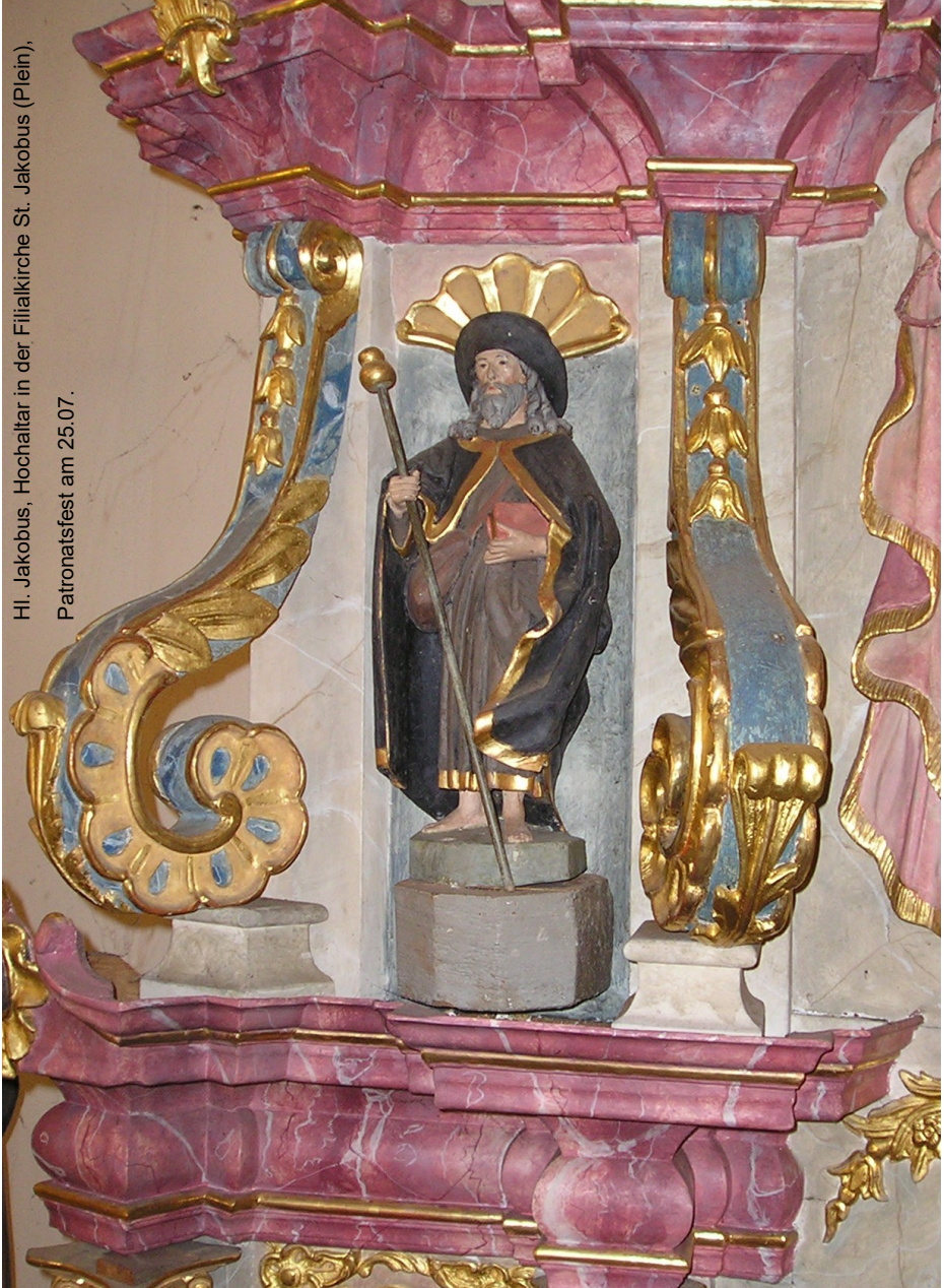
Hl. Jakobus, Hochaltar in der Filialkirche St. Jakobus (Plein), Patronatsfest am 25.07.